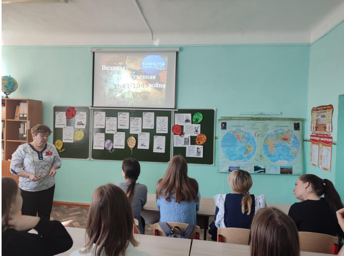
4 мая в школе провели торжественную линейку и субботник. Оба мероприятия были приурочены к празднику 9 Мая.